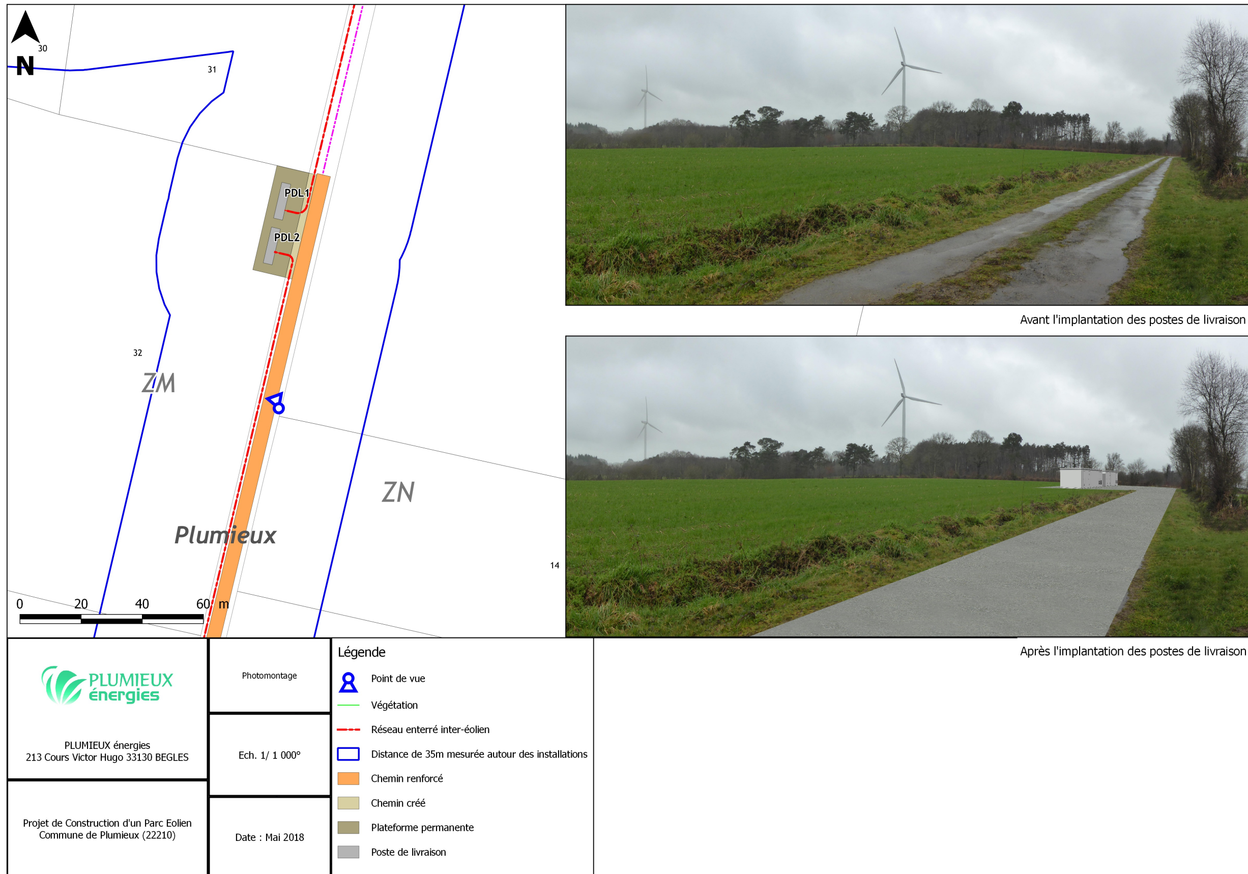
Figure 37 : Localisation des postes de livraison et simulation après implantation