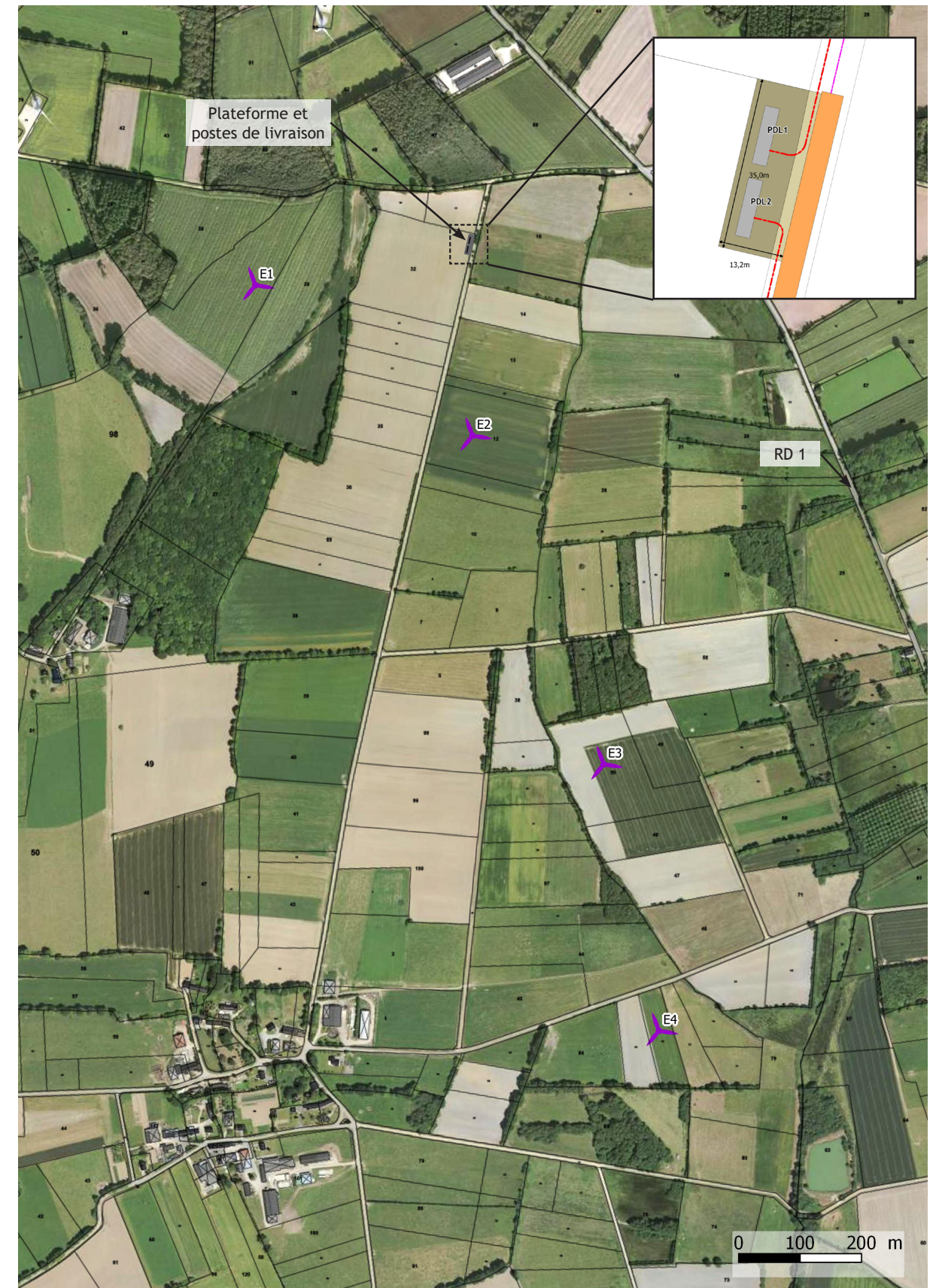
Figure 36 : Localisation des postes de livraison